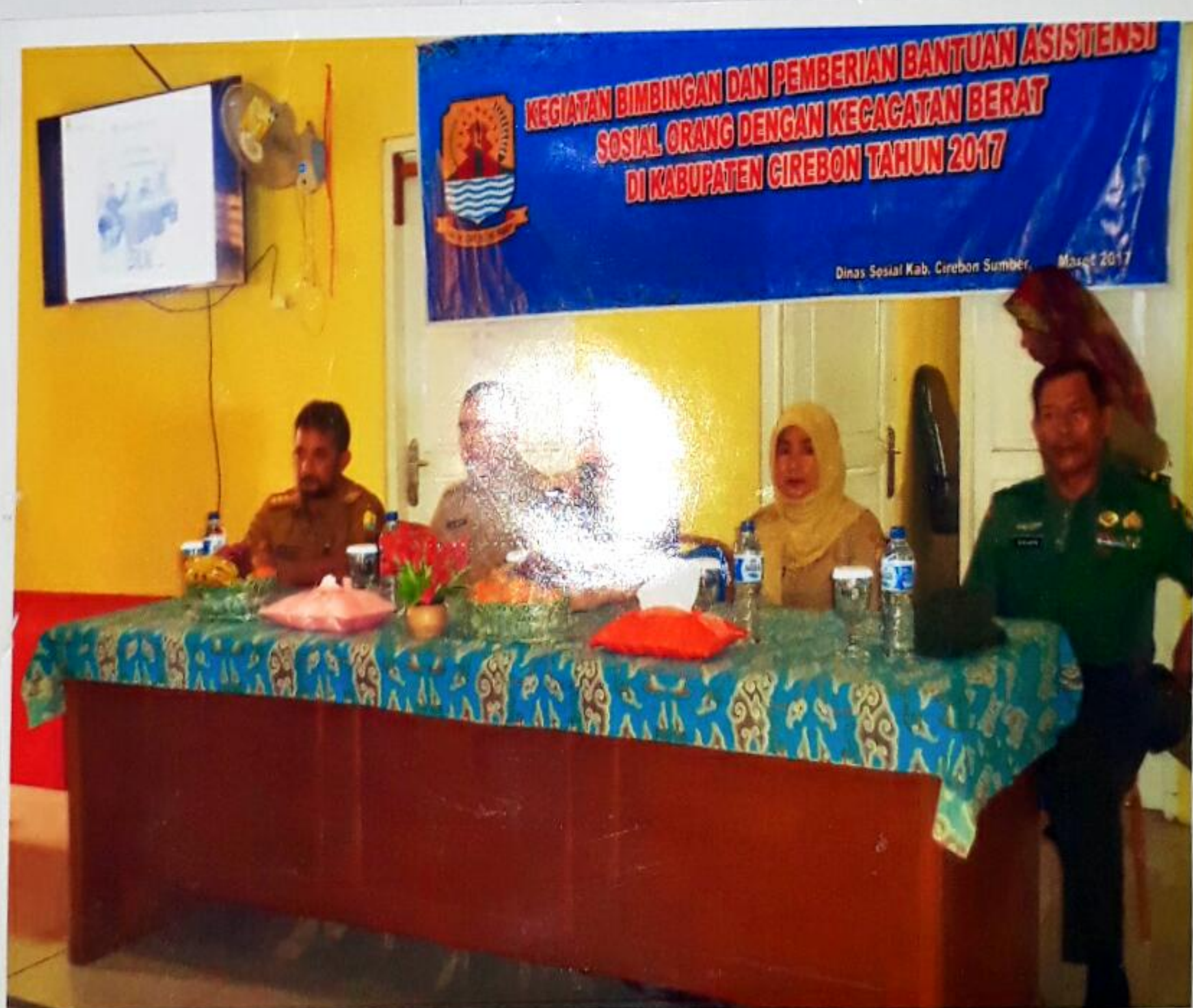
IBU BUPATI CIREBON, SEKERTARIS DAN KEPALA BIDANG REHABILITASI SOSIAL DINAS SOSIAL KABUPATEN CIREBON SEDANG MEMBERIKAN SAMBUTAN SEKALIGUS MEMBUKA ACARA SECARA RESMI PADA KEGIATAN BIMBINGAN DAN PEMBERIAN BANTUAN ASISTENSI SOSIAL ORANG DENGAN KECACATAN BERAT DI KABUPATEN CIREBON TAHUN ANGGARAN 2017