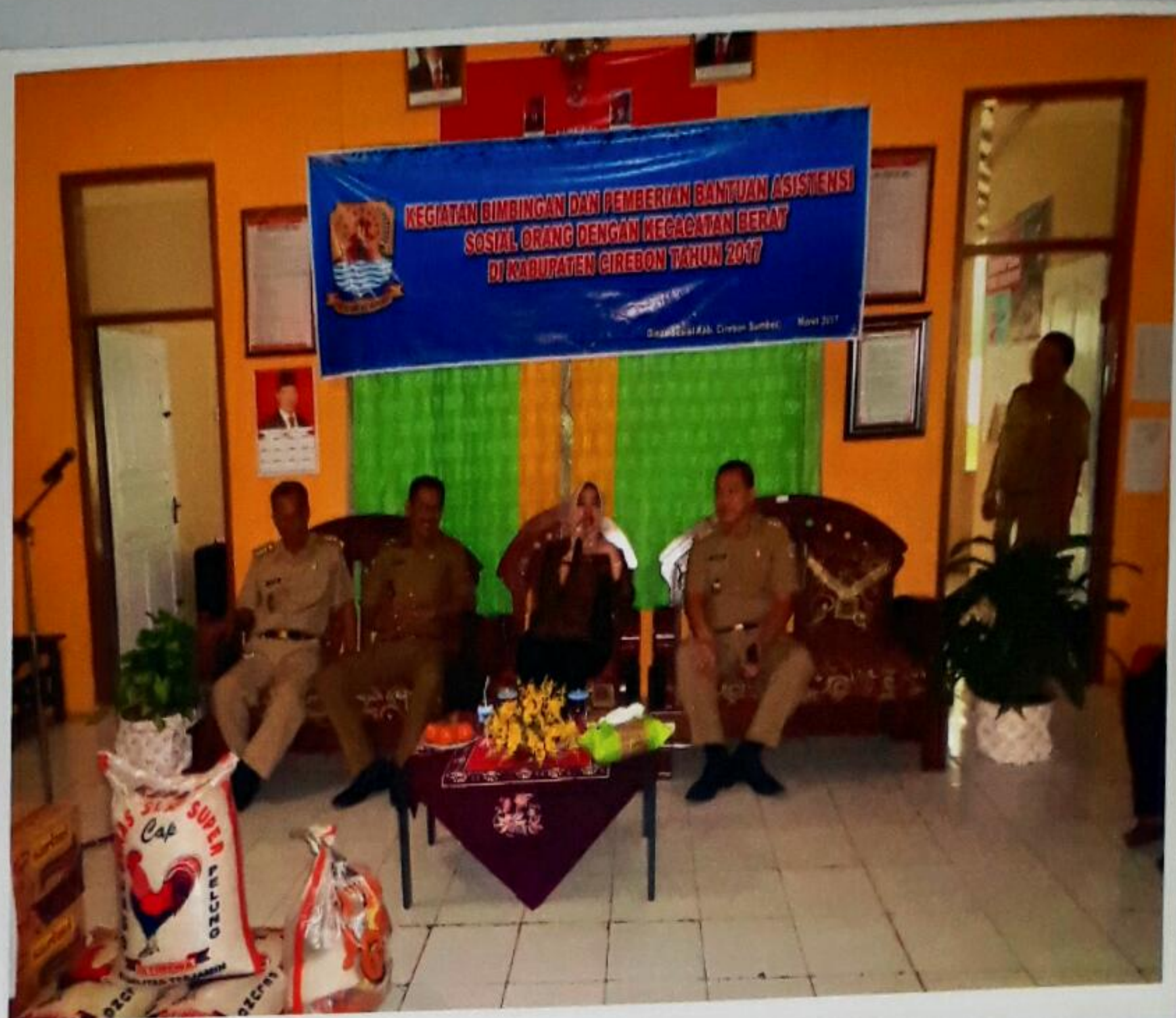
IBU BUPATI CIREBON DAN SEKERTARIS DINAS SOSIAL KABUPATEN CIREBON SEDANG MEMBERIKAN SAMBUTAN SEKALIGUS MEMBUKA ACARA SECARA RESMI PADA KEGIATAN BIMBINGAN DAN PEMBERIAN BANTUAN ASISTENSI SOSIAL ORANG DENGAN KECACATAN BERAT DI KABUPATEN CIREBON TAHUN ANGGARAN 2017