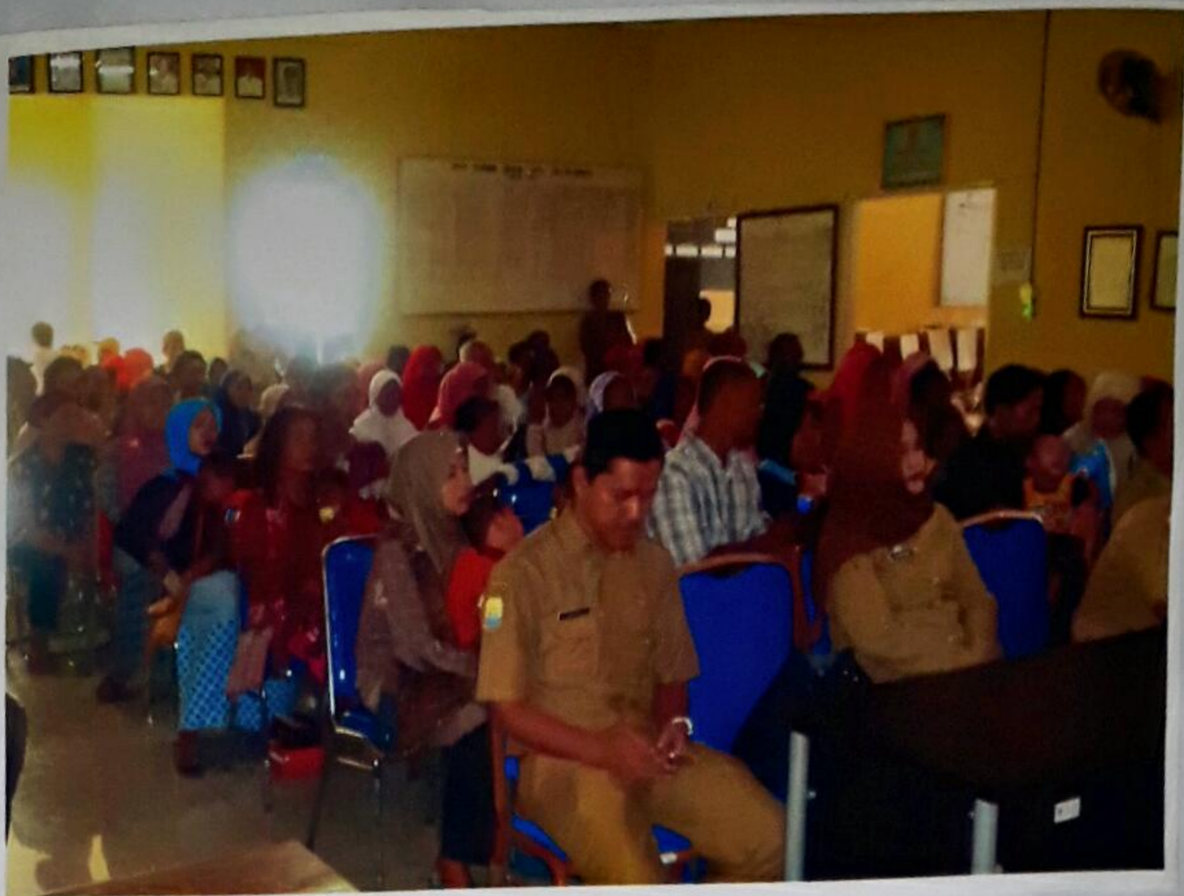
PESERTA KEGIATAN SEDANG MENGIKUTI PENGARAHAN DARI IBU BUPATI CIREBON TAHUN ANGGARAN 2017 PADA KEGIATAN BIMBINGAN DAN PEMBERIAN BANTUAN ASISTENSI SOSIAL ORANG DENGAN KECACATAN BERAT DI KABUPATEN CIREBON TAHUN ANGGARAN 2017