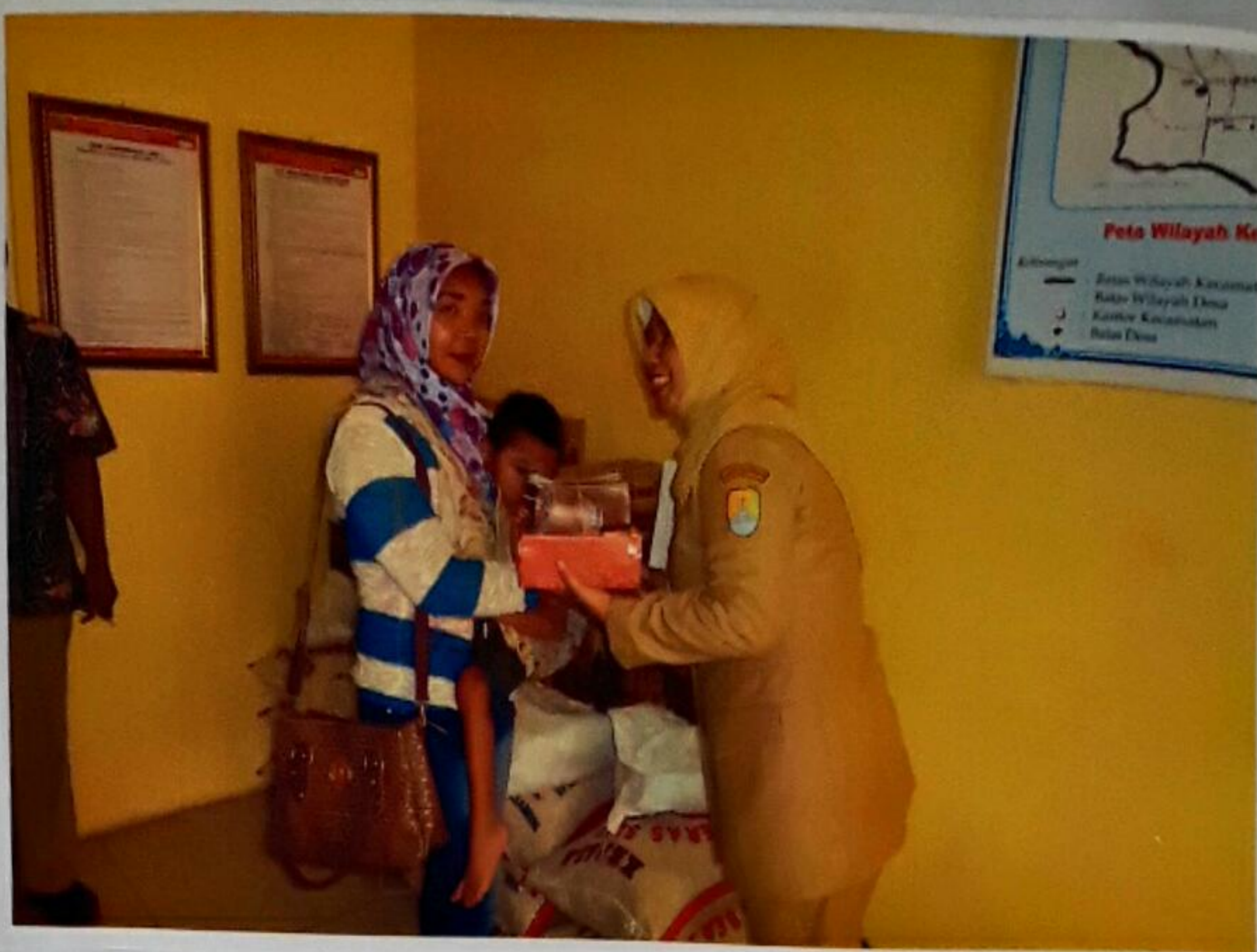
KEPALA BIDANG REHABILITASI SOSIAL DINAS SOSIAL KABUPATEN CIREBON MEMBERIKAN BANTUAN SOSIAL SECARA SIMBOLIS BERUPA PAKET SEMBAKO KEPADA PERWAKILAN ORANG TUA/WALI PADA KEGIATAN BIMBINGAN DAN PEMBERIAN BANTUAN ASISTENSI SOSIAL ORANG DENGAN KECACATAN BERAT DI KABUPATEN CIREBON TAHUN ANGGARAN 2017