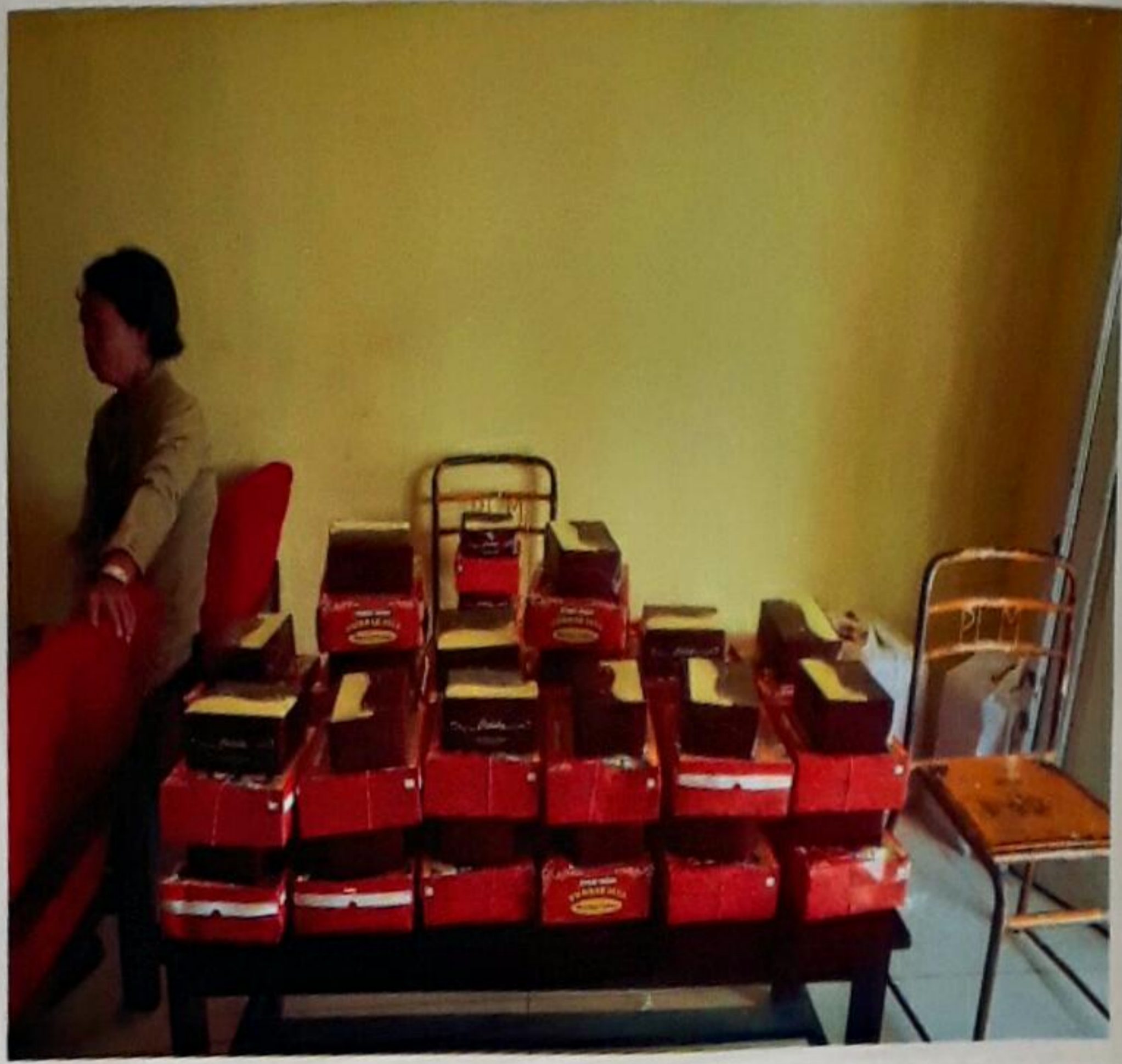
FASILITAS MAKAN DAN SNACK UNTUK PESERTA KEGIATAN PADA KEGIATAN BIMBINGAN DAN PEMBERIAN BANTUAN ASISTENSI SOSIAL ORANG DENGAN KECACATAN BERAT DI KABUPATEN CIREBON TAHUN ANGGARAN 2017