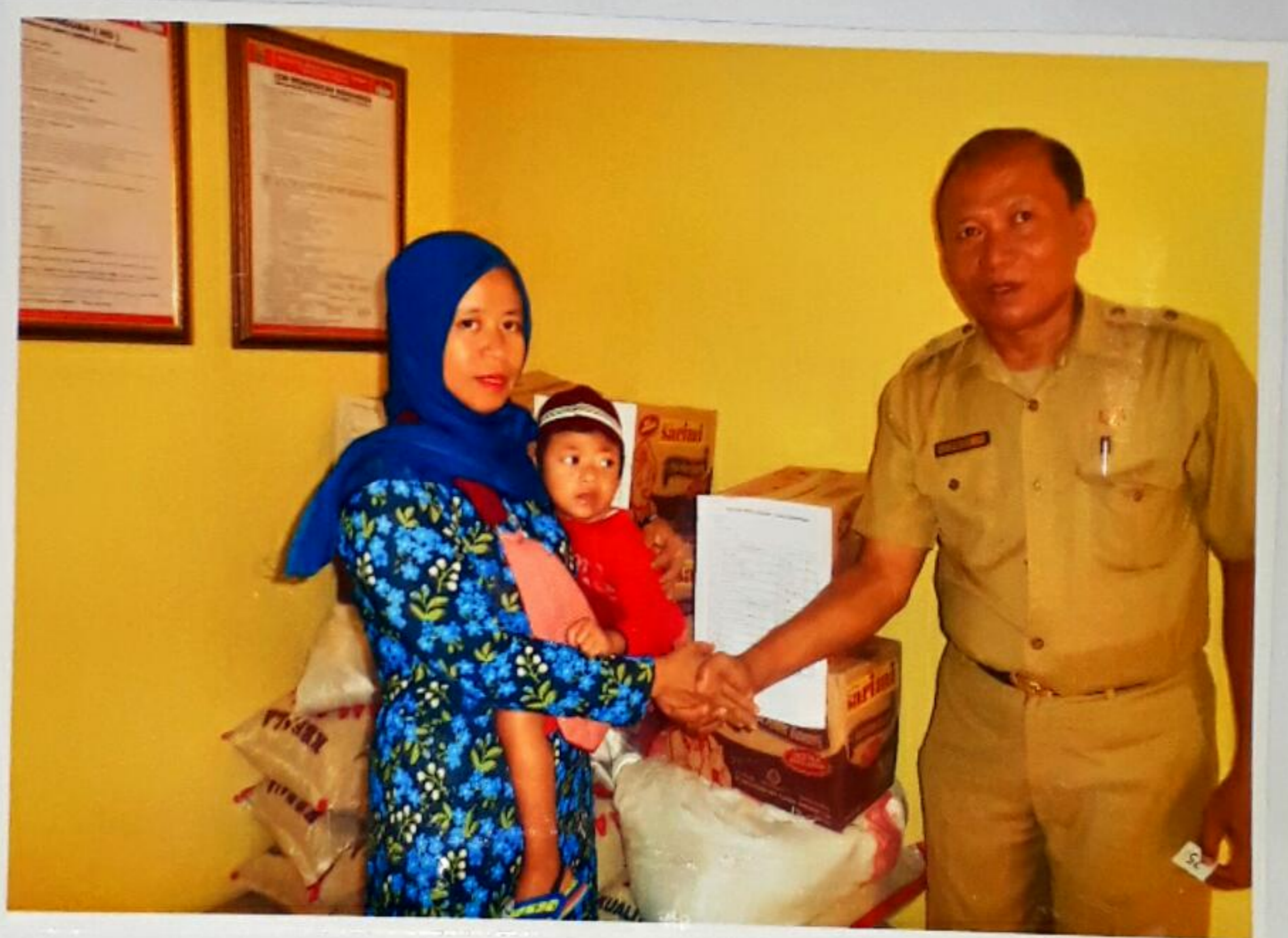
KASI PENYANDANG DISABILITAS REHABILITASI SOSIAL DINAS SOSIAL KABUPATEN CIREBON MEMBERIKAN BANTUAN SOSIAL SECARA SIMBOLIS BERUPA PAKET SEMBAKO KEPADA PERWAKILAN ORANG TUA/WALI PADA KEGIATAN BIMBINGAN DAN PEMBERIAN BANTUAN ASISTENSI SOSIAL ORANG DENGAN KECACATAN BERAT DI KABUPATEN CIREBON TAHUN ANGGARAN 2017