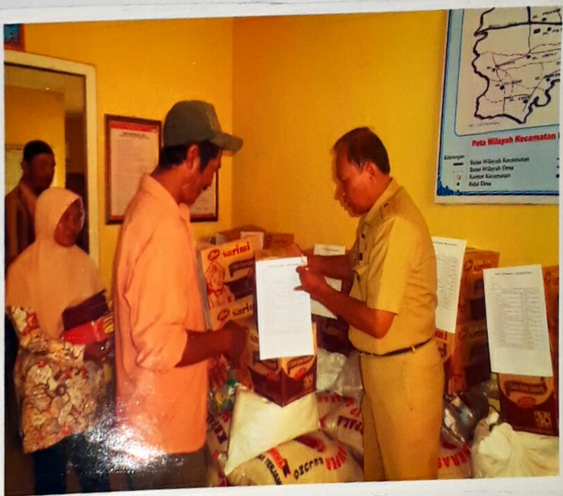
JENIS BARANG YANG DIBERIKAN PADA KEGIATAN BIMBINGAN DAN PEMBERIAN BANTUAN ASISTENSI SOSIAL ORANG DENGAN KECACATAN BERAT DI KABUPATEN CIREBON TAHUN ANGGARAN 2017