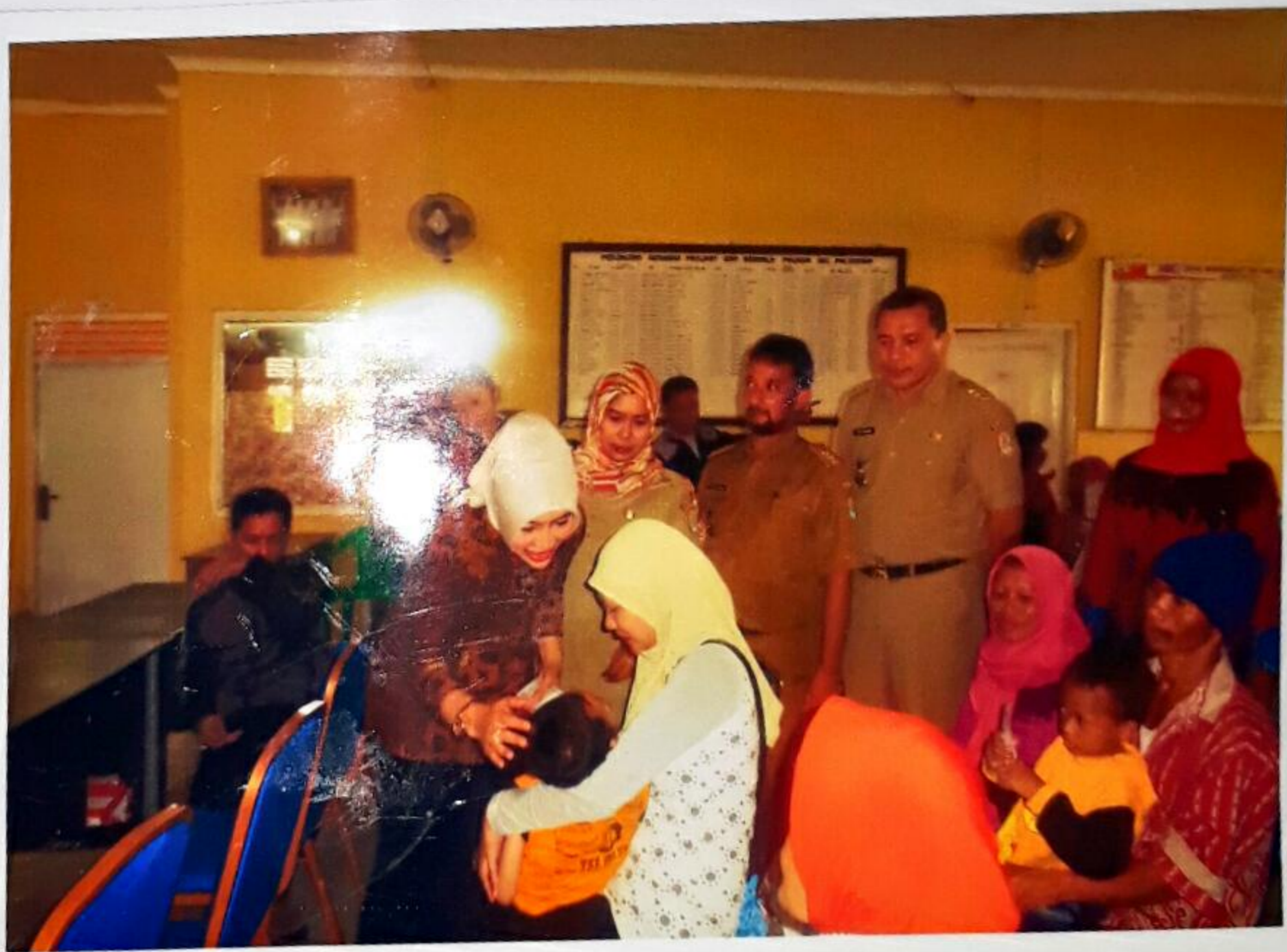
IBU BUPATI CIREBON MEMBERIKAN BANTUAN SOSIAL SECARA SIMBOLIS BERUPA PAKET SEMBAKO KEPADA PERWAKILAN ORANG TUA/WALI PADA KEGIATAN BIMBINGAN DAN PEMBERIAN BANTUAN ASISTENSI SOSIAL ORANG DENGAN KECACATAN BERAT DI KABUPATEN CIREBON TAHUN ANGGARAN 2017